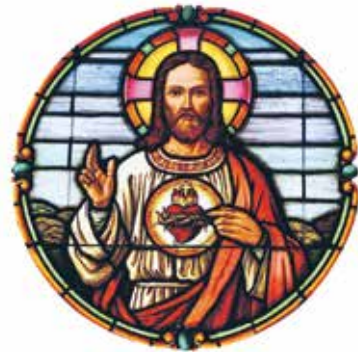
chiesa di Agra

Sinodo, Concistoro ed ora pure un'enciclica. Ottobre è stato un mese intenso per il Papa. Giovedì 24 è stata pubblicata la "Dilexit nos" ovvero «Ci ha amati», la quarta enciclica del suo pontificato. Il titolo è ispirato alle parole di San Paolo nella Lettera ai Romani 8, 37. L'importanza del cuore di Cristo contro l'invasione del consumismo: questo il nocciolo del nuovo documento. Si apre con una riflessione su una delle iconografie cristiane più famose: «per esprimere l'amore di Gesù si usa spesso il simbolo del cuore. Alcuni si domandano se esso abbia un significato tuttora valido. Ma quando siamo tentati di navigare in superficie, di vivere di corsa senza sapere alla fine perché, di diventare consumatori insaziabili e schiavi degli ingranaggi di un mercato a cui non interessa il senso della nostra esistenza, abbiamo bisogno di