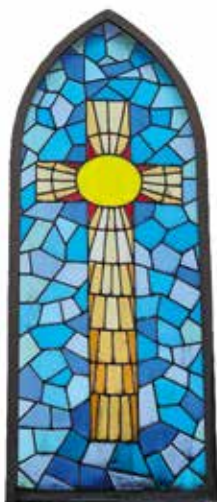
Cimitero di St. Abbondio